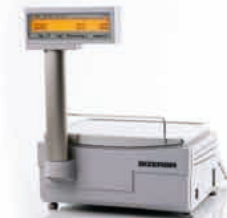
BC II 200 F-E Elektronische Pultwaage mit kundenseitiger Anzeige auf Stativ