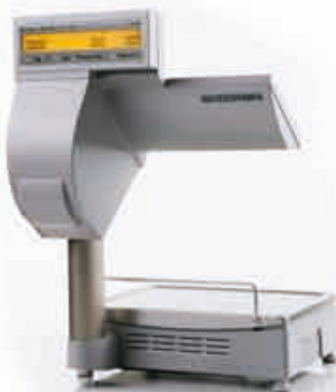
BC II 800 E Elektronische Ladenwaage mit Anzeige-, Bedien- und Druckereinheit auf Stativ

Vielseitig einsetzbar, bieten BC II Waagen alle für eine Bizerba Waage heute typischen Funktionen und Leistungsmerkmale, sind zuverlässig, schnell und einfach zu handhaben. Immer mit Blickkontakt zum Kunden.