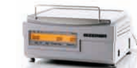
BC II 100 E Elektronische Pultwaage mit Etikettendrucker